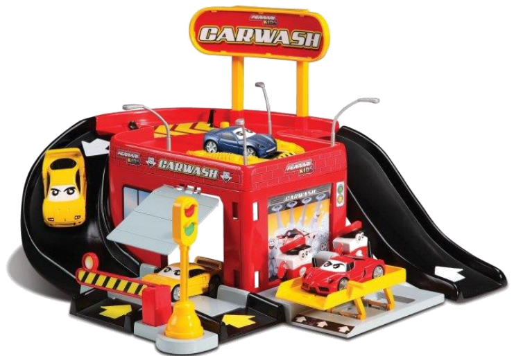
Ilustračný obrázok č. 4