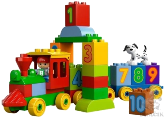
Ilustračný obrázok č. 3